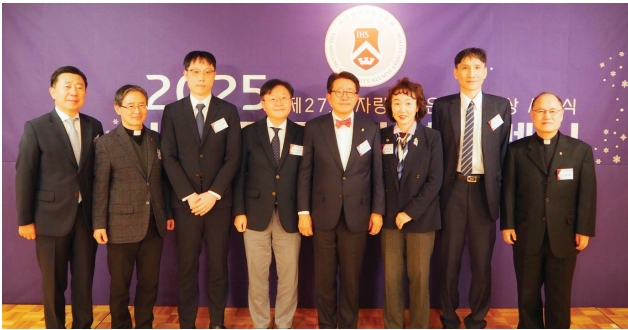
〈서강대학교 총동문회 신년하례식〉

서강대학교 총동문회는 2025년 새해를 맞아 1월 9일(목) 저녁, 서울 소공동 롯데호텔 사파이어볼룸에서 신년하례식을 개최하였다. 이날 행사에는 총 205명의 동문이 참석했으며, 자랑스러운 서강인상과 서강알바트로스학술상 시상식이 함께 진행되