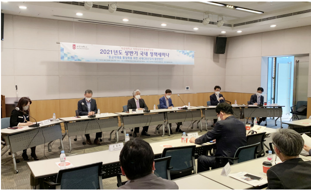
〈 지암남덕우경제연구원 정책세미나: 중금리대출 활성화를 위한 국내 CB산업의 발전방안 〉

지난 4월 22일, 여의도 전경련회관에서 ‘중금리대출 활성화를 위한 국내 CB산업의 발전방안’ 주제로 정책세미나가 개최되