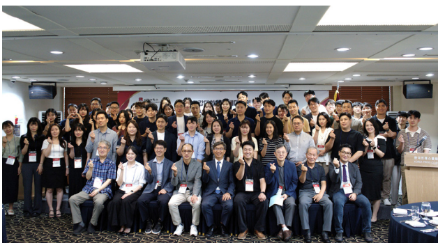
〈제70기 경제대학원 신입생 입학식 및 오리엔테이션(OT) 참석자들의 단체사진〉

지난 8월 16일(토), 서울 프레스 센터 18층 서울클럽에서 「서강대학교 경제대학원 제70기 신입생 입학식 및 오리엔테이