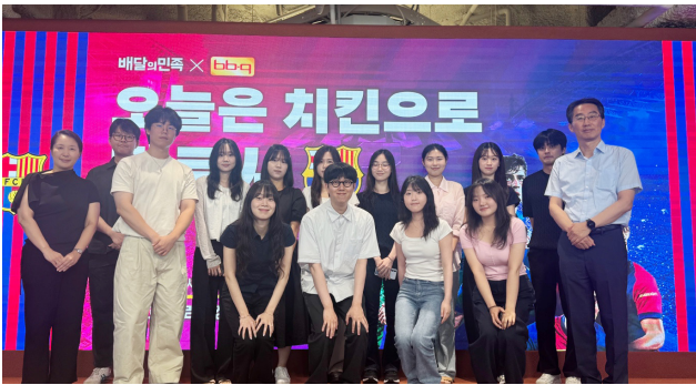
〈'우아한형제들' 기업 방문 참여 인원 단체 사진〉

2025년 7월 9일, 본 학과는 디지털 플랫폼 산업에 대한 이해를 심화하고자 우아한형제들(배달의민족) 본사를 방문하였다. 이번 방문은 최근 학문적으로 큰 주목을 받는 플랫폼 비즈니스의 실제 작동 원리와 데이터 기반 의사결정 구조를 직접 체험할 행사는 서울 송파구에 위치한 우아한형제들 본사에서 진행되었으며, 약 2시간에 걸쳐 기업 소개, 주요 서비스 구조, 배달 알고리즘의 데이터 기반 설계, 소비자 행동 분석, ESG 활동 등에 대한 발표가 이어졌다. 실무자와의 질의응답을 통해, 평소 이론으로만 접했던 플랫폼 경제의 실제 적용 사례를 더욱 깊이 이해할 기회가 되었다. 특히 플랫폼 내에서 이루어지는 가격 설정 메커니즘과 데이터 분석 기술의 활용은 디지털 경제와 관련된 연구 주제를 준비 중인 학생들에게 실질적인 인사이트를 제공하였다.