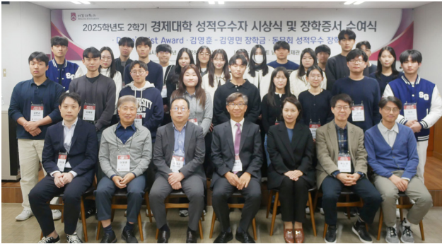
〈2025학년도 2학기 성적우수자 시상식 및 장학증서 수여식 단체사진〉