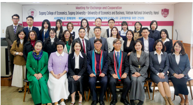
(서강대학교 경제대학 - 베트남 국립대학교 경제대학교(하노이) 간담회)

서강대학교 경제대학과 베트남국립대학교 하노이 경제대학교(University of Economics and Business, Vietnam National University, Hanoi, 이하 VNU-UEB)는 지난 10월 29일(화), 서강대학교 GN관 511호에서 교류협력을 위한 간담회를 개최하였다. 이번 간담회는 양교 간 학문 교류 및 향후 협력 방안을 모색하기 위해 마련된 자리로, 참석자들의 적극적인 참여 속에 성황리에 진행되었다.