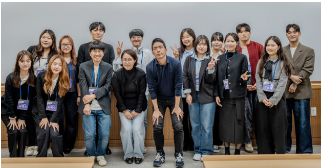
〈2025 연합 경제 학술제 Economic Open Network의 참석자들〉

2025년도 제1회 연합 경제 학술제 ‘EON(Economic Open Network)’이 지난 10월 11일(토), 서강대학교 GN관 202호에서 개최되었다. 한국응용경제학회가 주관하고 성균관대학교·서강대학교·이화여자대학교 경제학과 학생회가 공동 주최한 이번 학술제는 “학문을 통한 연대와 성장”을 주제로, 각 대학 예선을 통과한 팀들이 모여 경제학적 분석을 바탕으로 연구 성과를 공유하고 대학 간 학문 교류와 협력을 도모하기 위해 마련되었다.