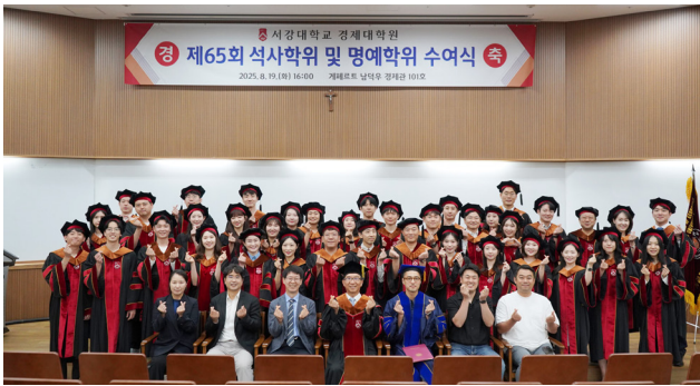
〈서강대학교 경제대학원 제 65회 학위수여식〉