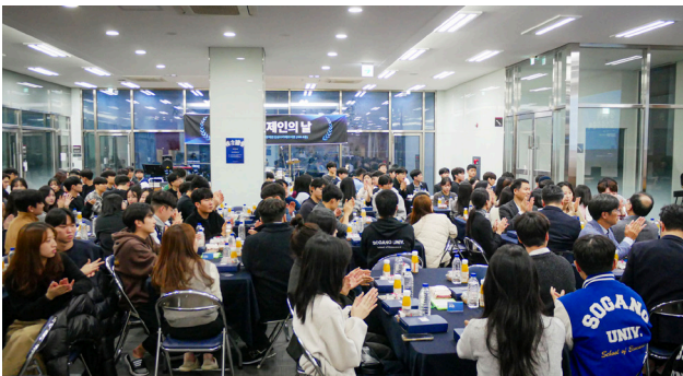
〈늦은 저녁 시간에도 불구하고 자리를 지켜주었던 서강대학교 경제학과 관련 인원들〉